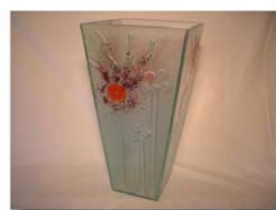
Golv vas 45 cm Pris 1.600:-