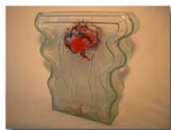
Vas med vågig sida H= 33 cm Pris 1.900:-