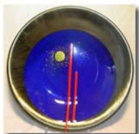
Glasfat 40 cm 1.500:- Glasfat 50 cm 2.100:-