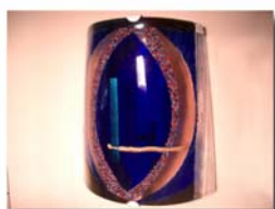
Vägglampa 28x32 cm 1.200:- Vägglampa 25x23 cm 900:-