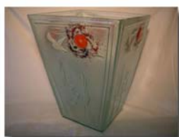
Golv vas H= 45 cm Pris 1.900:-