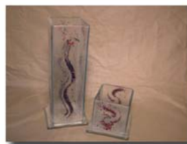
Lyktor H= 30 och 14 cm Pris 350:- och 200:-