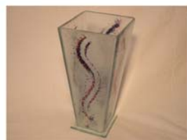
Vas H= 26 cm Pris 350:-