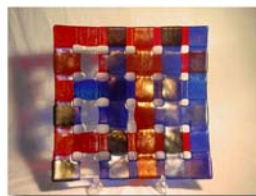
Glasfat 40 cm Pris 1.500:-