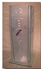
Vas/Lykta H= 50 cm Pris 1.900:-