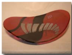
Ovalt fat på fot 46x38 cm Pris 2.400:-