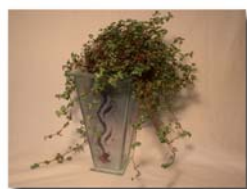
Vas med lös insats H= 25 cm Pris 450:-