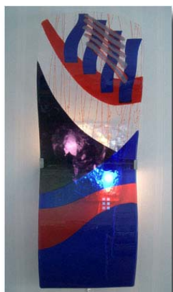
Vägglampa 85x30 cm Pris inkl fäste 4.900:-