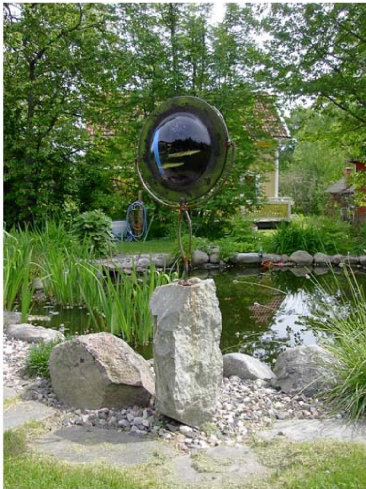
Trädgårdsskulptur i glas.

Glaset är vädertåligt och passar fint även i trädgården eller på altanen.