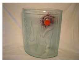
Golvvas H= 45 cm Pris 2.300:-